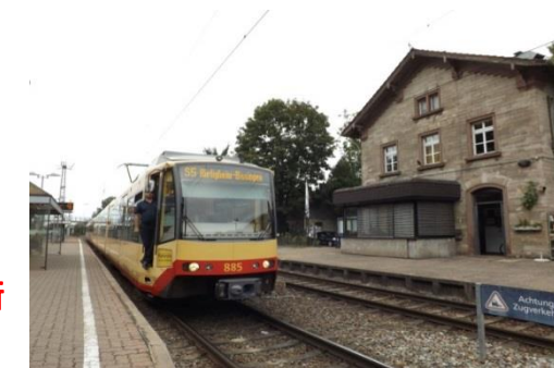
鉄道路線も走る路面電車