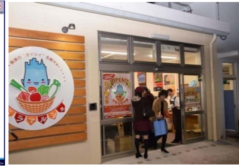
魚津駅「ミラマルシェ」