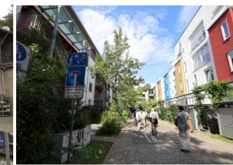
人が最優先の住宅街