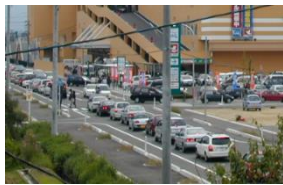
郊外店舗付近の渋滞