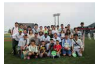
▲同友会の日 富山サンダーバース戦観戦