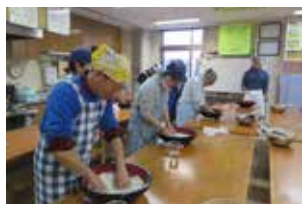
▲第8回六次産業化委員会 そばうち体験