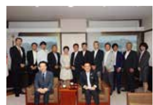
▲第4回経営・CSR委員会 県外視察