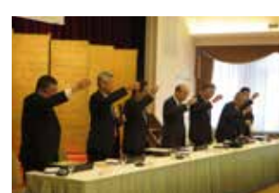
▲平成27年度 第1回常任幹事会