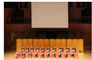
▲第28回全国経済同友会セミナー