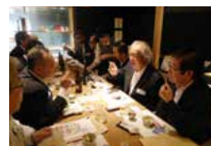
▲「全国立山大使の会」キックオフミーティング