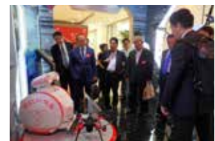
▲代表幹事北京ミッション