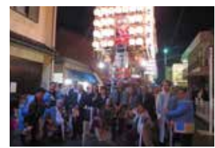
▲第11回芸術文化委員会