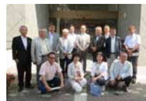
▲経済同友会中央日本地区会議