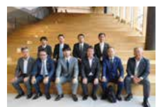
▲第3回環境問題委員会