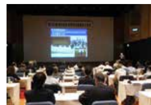
▲第6回経済同友会教育担当委員会交流会