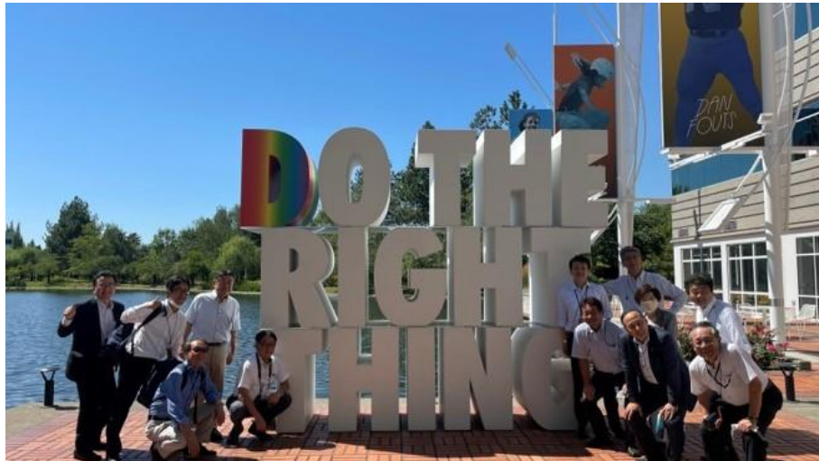
モニュメントの前で記念写真