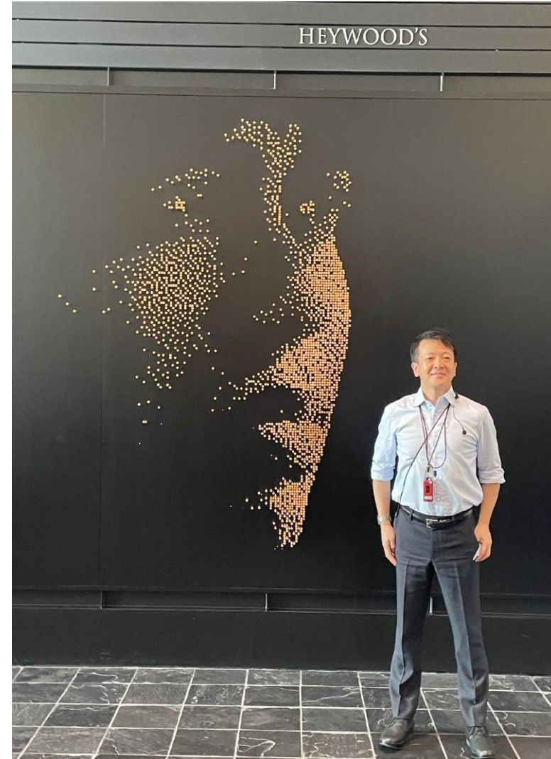
タイガーウッズコーナー