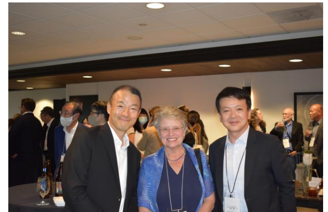
レセプションの様子