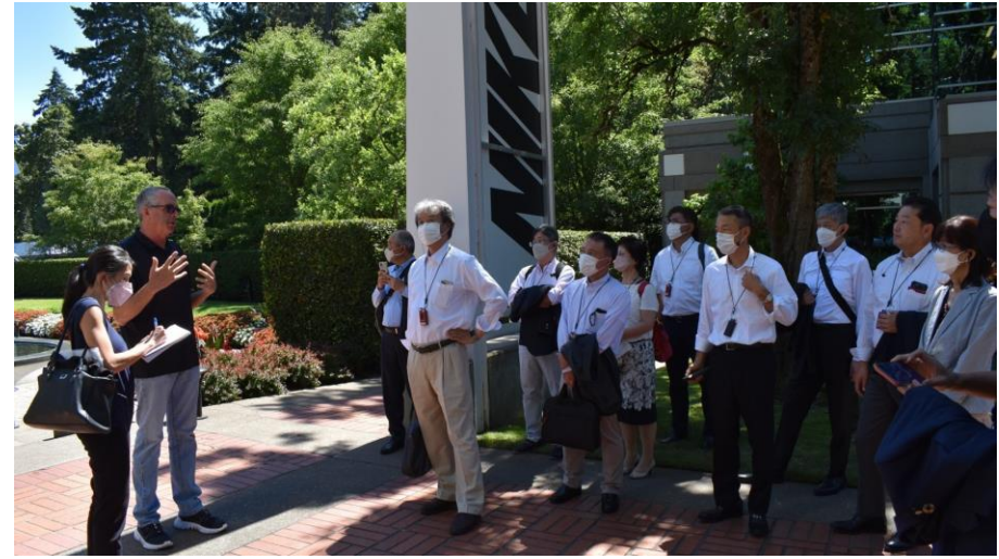
ボランティアスタッフによるガイド