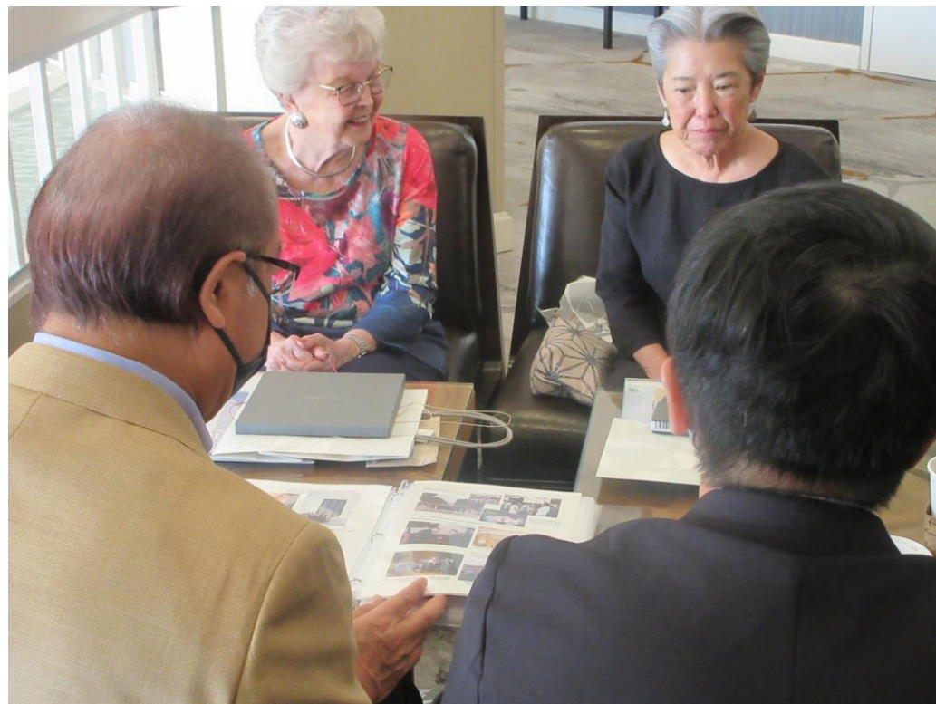
バーバラ・ロバーツ州知事（左側）