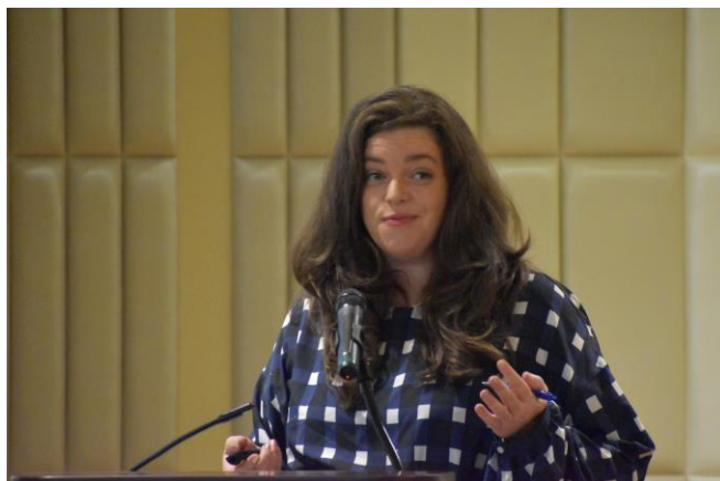
アマンダ・ウェルカー 州経済開発局戦略官の 経済レクチャー