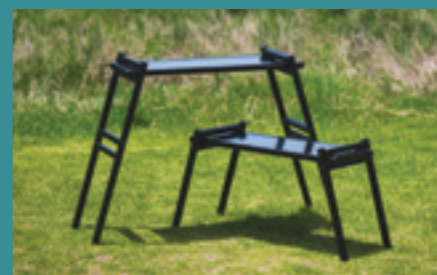
ビジネスモデルと知財活用

デザイン思考やアート思考の観点から企業の組織や財務との関係性を紐とぎ、会社や経営者へ影響をあたえたケースを過去事例より紹介します。