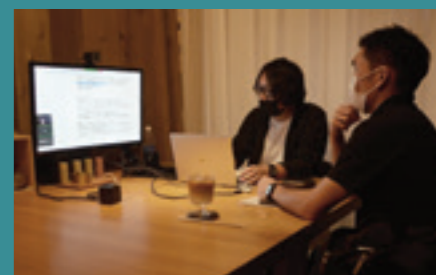
デザイン思考を活用した伴走支援

デザインやクリエイティブの能力を活かし、企業が活用できるビジネスモデルや意匠、商標など知財専門家より過去事例を紹介します。