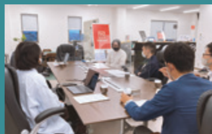
企業の組織・財務とデザイン

本プログラムではデザインプロデューサーが経営の最上流から参画し、経営者と向き合いながら意思決定・課題解決がおこなえるプロデューサー育成を目的としています。デザイン経営セミナーではデザイナーやクリエイター・マーケッターのもつ創造性や思考、デザイン能力を活かし「組織」や「財務」の座学を中心に組織を巻き込む為の手法、企業で活用できる知財やビジネスモデル、伴走支援の事例など経営コンサルティングとデザイン活用を兼ね備えたセミナーです。