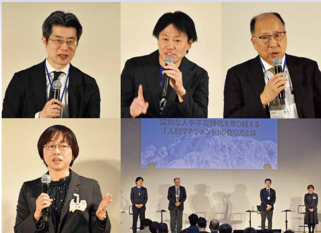
第3回人財育成・活躍委員会（3月22日）