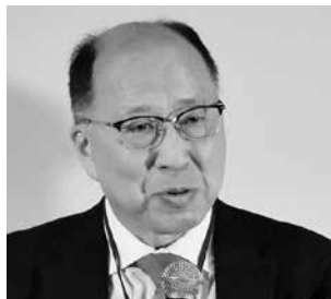
遠藤 俊英 氏

遠藤氏は、金融庁長官時代に導入した「政策オープンラボ」を例に、従業員の潜在能力を引き出すことの重要性について説明。既存業務の枠を超えたところに価値創出が生まれるとし、AIについても「人の能力を代替するものではなく拡張するもの」と位置づけた。また、現場で培われる「暗黙知」の共有や心理的安全性の確保が、イノベーションの源泉になるとの考えを示した。